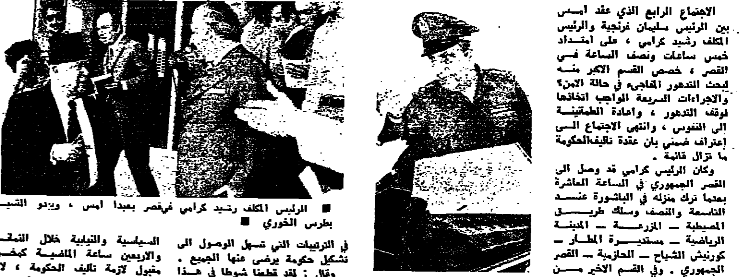
الرئيس المكلف رشيد كرامي في مقره بجدة امس، ويبدو التبريد بطرس الخوري